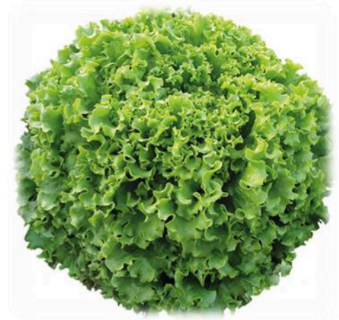
Şekil 1. Çalışmada kullanılan çeşit