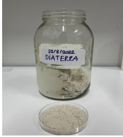
Şekil 3.1. Çalışmada kullanılan Diaterra® diatom toprağı

Çalışmada yerel diatom toprağı olan Diaterra® (Organomineral Ltd. Şti., Türkiye) kullanılmıştır. Diaterra®'nın kimyasal bileşimi ise şu şekildedir: %72.8 SiO 2 , %9.0 Al 2 O 3 , %2.40 Fe 2 O 3 , %1.70 CaO, %2.40 MgO, %0.10 MnO, %0.20 P 2 O 5 , %0.20 Na 2 O, %0.90 K 2 O ve %0.40 TiO 2 (Alkan ve ark., 2023) (Şekil 3.1 ve 3.2).