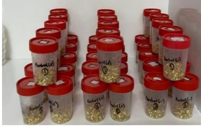
Şekil 3.5. Diatom toprağı besin uygulamaları