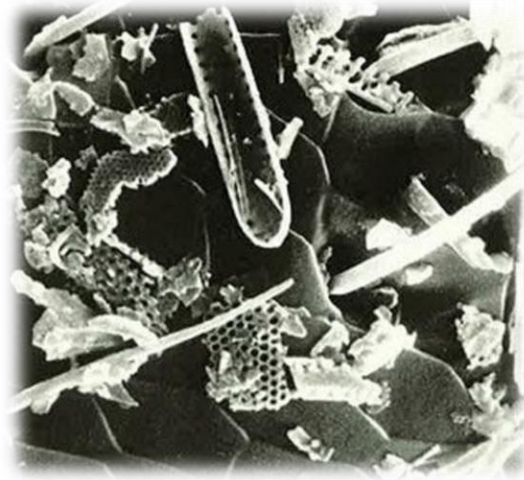
Şekil 3.2. Diaterra® toprağını oluşturan diatomitlerin elektron mikroskop görüntüleri (Anonim, 2021)