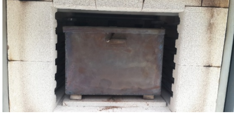
Şekil 1. Biyoçar üretimi için özel imal edilmiş çelik kap