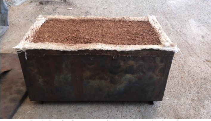
Şekil 2. Biyokömür üretimi yapılan çelik kasalar

Çalışmada biyoçar ana materyali olarak, Giresun ilinden temin edilen fındık kabukları kullanılmıştır. Temin edilen fındık kabukları öğütüldükten sonra özel hazırlanmış hava almayacak çelik kasalara koyularak, 500°C'ye ayarlanan kül fırınında proliz edilmiş ve biyokömür materyali elde edilmiştir. Kullanılan çelik kasalar ve kül fırını Şekil 2 ve Şekil 3'de gösterilmektedir.