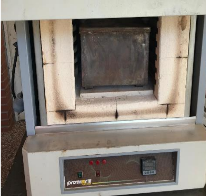
Şekil 3. Biyokömür üretimi yapılan kül fırını

Çalışmada biyoçar ana materyali olarak, Giresun ilinden temin edilen fındık kabukları kullanılmıştır. Temin edilen fındık kabukları öğütüldükten sonra özel hazırlanmış hava almayacak çelik kasalara koyularak, 500°C'ye ayarlanan kül fırınında proliz edilmiş ve biyokömür materyali elde edilmiştir. Kullanılan çelik kasalar ve kül fırını Şekil 2 ve Şekil 3'de gösterilmektedir.