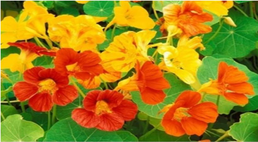
Şekil 1. Latin Çiçekleri ( Tropaeolum majus L. )

Latin çiçekleri tohumları, tohum çıkışlarında sorun yaşanmaması için yalnızca torf doldurulmuş viyollere ekilmiştir. Viyoller sürekli nemli tutularak tohum çimlenmesi sağlanmıştır. Bitki çıkışları başladıktan sonra bitkiler 2-3 yapraklı hale gelene kadar su ihtiyaçları karşılanarak viyollerde muhafaza edilmiştir.