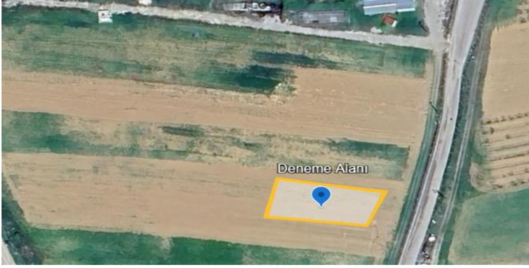
Şekil 3.1. Araştırmanın yürütüldüğü deneme arazisi