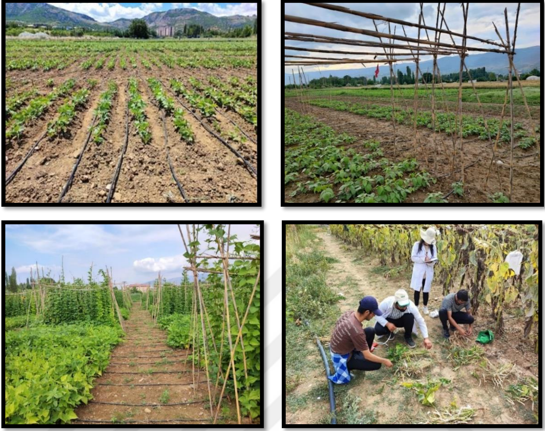
Şekil 3.3. Deneme alanına ait bitkilerin farklı dönem görüntüleri