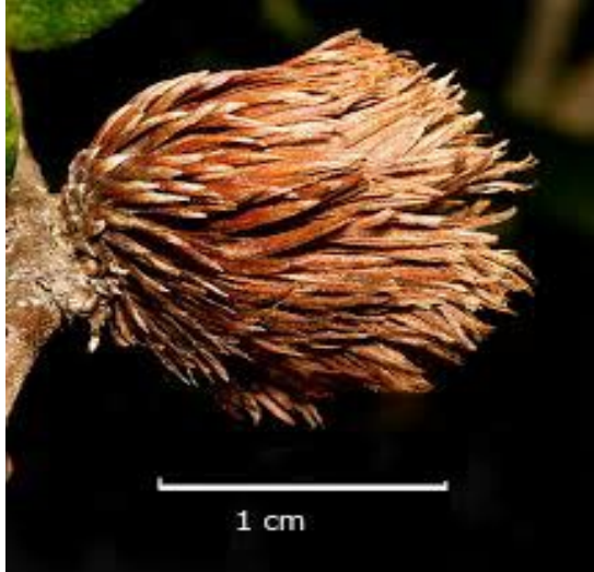
Şekil 5. Andricus quercusfoliatus türüne ait yaprak benzeri yapılarla kaplı gal görünümü (Schmidt, 2015)

Meşe ağaçlarında neden olduğu galler “yaprak meşe gali” olarak da tanımlanır. Q. virginiana , Q. geminata türlerinde yaprak benzeri yapılarla kaplı gallere neden olur (Şekil 5).