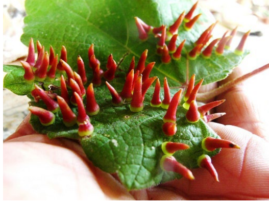
Şekil 3. Schizomyia viticola (Harvey, 2014)

Arı Galleri (Hymenoptera/ Cynipidae): Boyut, şekil,doku ve renk bakımından en çok çeşitliliğin görüldüğü takımdır. Gal yapan canlılar arasınca Cynipidae familyası özel bir yere sahiptir ve en geniş gruptan biridir (Stone vd. 2008, İpekdal vd., 2014; Buffington vd. 2020). Ancak bazı Cynipidae türleri ise gal oluşturmayarak larvalarını başka galler içine bırakırlar (Ronquist vd., 2015; Pénez vd., 2018; Buffington vd., 2020; Azmaz,2021).