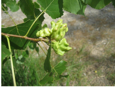
Şekil 1 ( Mordwilkoja vagabunda 'ya ait gal yapısı) (Boles, 2020)

Psillid Galleri (Hemiptera/ Pysillidae): Genellikle orman ağaçlarından çitlembik türlerinde görülür (Şekil 2). Ayrıca avokado ağaçlarında gal yapımlarıyla bilinirler. Salgıladıkları tatlımsı madde nedeniyle ağaçların yaprak yüzeyince ciddi birikimlere neden olurlar, bu yüzden ağaca en çok zarar verdiği düşünülen türlerdir.