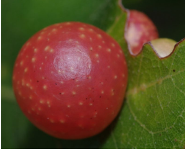
Şekil 12. Yaprak yüzeyinde Trigonaspis polita ya ait gal yapısı (Pynklynx, 2020)