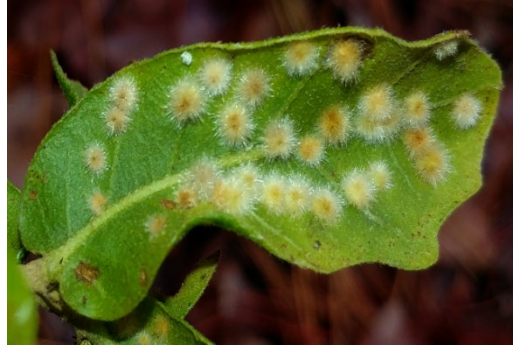
Şekil 14. Neuroterus quercusverrucarum a ait galler (Wilson, 2016)