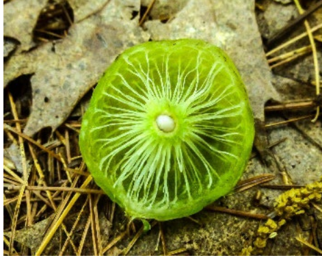
Şekil 4. Amphibolips murata 'ya ait galin ağ benzeri iç yapısı (NH Garden Solutions, 2016)