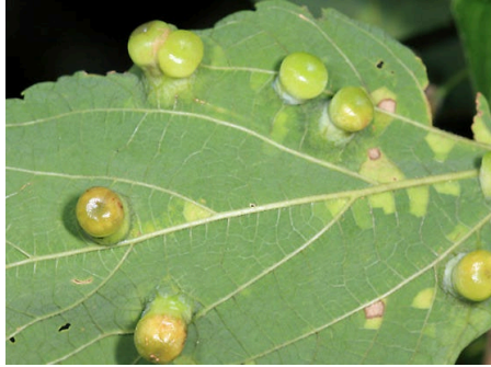
Şekil 2 (Çitlembik türünde görülen Pachypsylla celtidismamma ya ait gal yapısı) (Murray, 2012)

Sinek Galleri (Diptera/ Cecidomyiidae): Bu türlere ait galler çok yaygındır ve genellikle kuru çalılıklarda görülür. Türlerle göre sinek galleri çok farklı görünümlere sahip olabilir (Şekil 3).