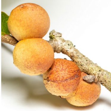
Şekil 9. Disholcaspis quercusomnivora türüne ait gal yapısı (Zhang, n.d.)

Quercus chapmanii türünde görülen galler başlangıçta kırmızı ve sarı renklerdeyken olgunlaştıkça kahverengileşir (Şekil 9). Artan lignin sayesinde çok sert ve dayanıklı bir yapı halini alır. Kuruyan gal üzerinde arının çıkış yaptığı delikler görülür. Bu yapılar ağaçta uzun yıllar asılı kalır.