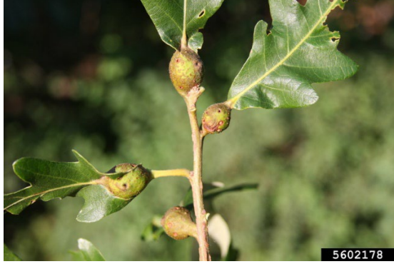
Şekil 7. Andricus quercuspetiolicola 'nın meşe yaprak sapında görülen gal yapısı (Katovich, n.d.)