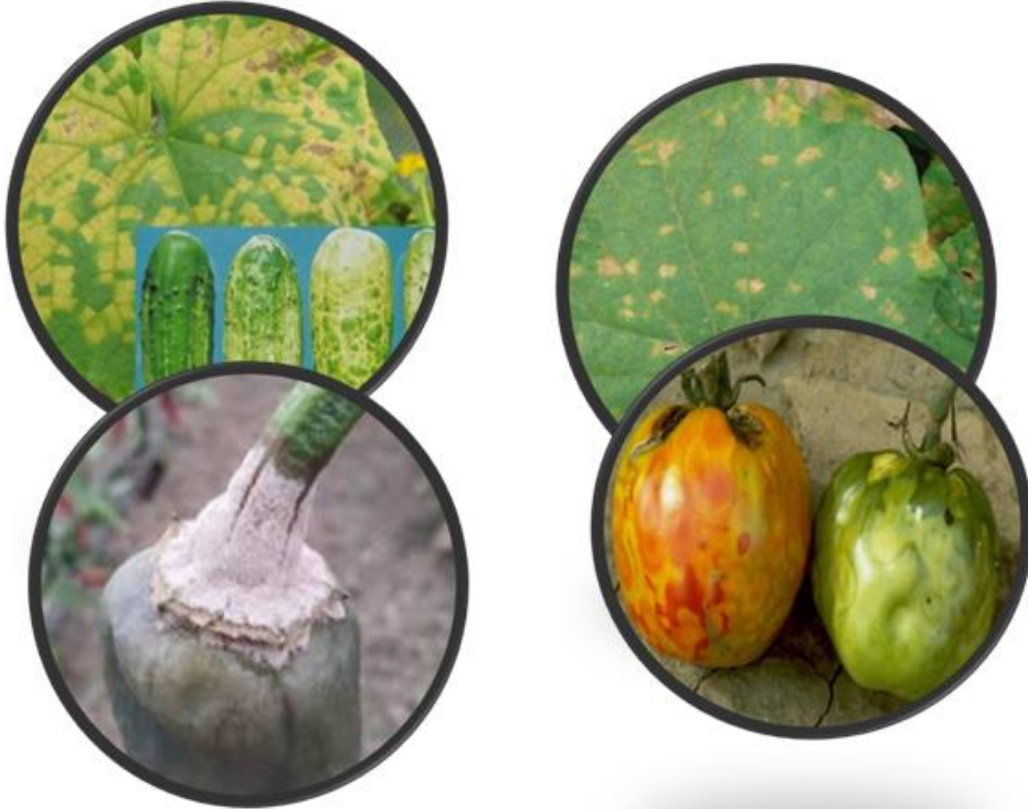
Şekil 3. Örtüaltında sorun olan başlıca hastalıklar