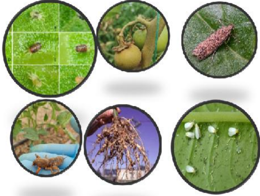
Şekil 2. Örtüaltında sorun olan başlıca zararlılar

Örtü altında kültür bitkilerinde olduğu gibi bitki koruma problemleri görülmektedir. Bunların başında ise sırasıyla; Kırmızı örümcekler [ Tetranychus urticae Koch.], Domates pasakarı [ Aculops lycopersici , Domates güvesi [ Tuta absoluta (Meyrick)], Danaburnu [ Grylotalpa grylotalpa (L.)], Kök ur nematodları ( Meloidogyne spp. , Goeldi), Tütün beyazsineği [ Bemisia tabaci (Genn.)] (Şekil 2) ve Hıyar mozaik virüsü ( Cucumber mosaic virus ), Kabakgillerde Mildiyö ( Pseudoperonospora cubensis Berk. and Curt.), Kurşuni Küf ( Botrytis cinerea Pers.), Domates lekeli solgunluk virüsü (Tomato spotted wilt virus) Şekil 3.